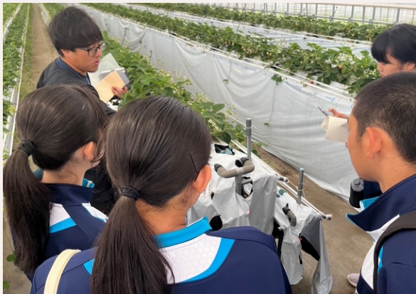
1 学年フィールドワーク 町内事業者から、いちごの栽培方法について説明を受ける様子