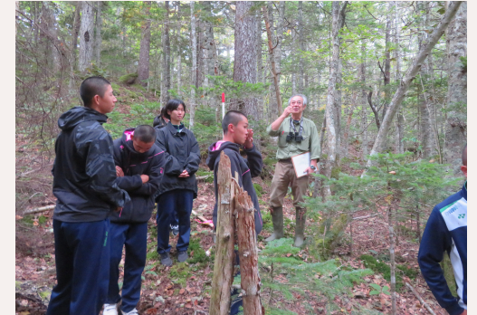
2 学年 茂足寄訪問 環境の変化による生物の生息状況の観察