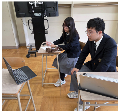
2 学年フィールドワーク 町外事業者と、オンラインで情報収集する様子