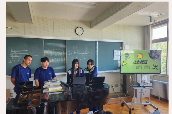
2 学年中間報告会 探究活動の現状と展望をグループにて共有